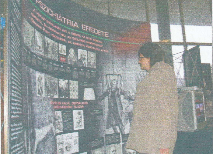
A pszichiátria történetét transzparensen mutatják be az érdeklődőknek.

Az emberjogi szervezet azt ál- lítja, hogy a pszichiátria a hata- lom eszköze, és annak fenntar- tója, amely óriási összegeket emészt fel. A tiltakozók szerint a